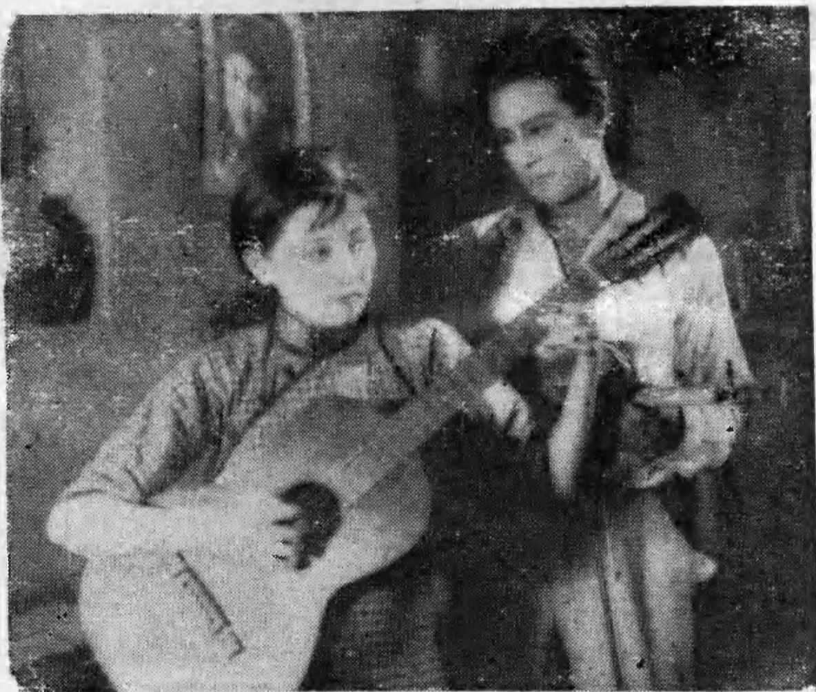
→ 「野草閒花」中之阮玲玉與金燄